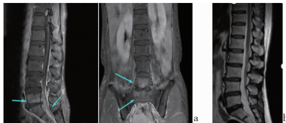
注: a 为治疗前; b 为治疗后。

1.4 病原学鉴定 患者高热时, 采集双套血培养瓶, 报阳时间分别为 17 时 26 分 (左上肢需氧瓶)、16 时 6 分 (左上肢厌氧瓶)、17 时 46 分 (右上肢需氧瓶)、13 时 36 分 (右上肢厌氧瓶)。微生物工作人员