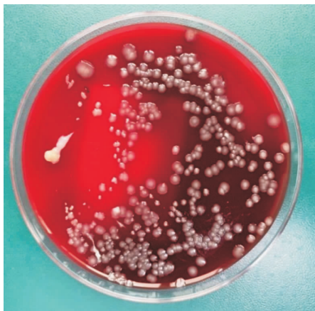
图1 骨组织接种羊血琼脂平皿48 h后菌落形态

患者,男性,58岁,因“腰背部疼痛20年,并伴左下肢放射痛,加重1个月”于2021年12月7日入住西京医院骨科。患者于20年前无明显诱因外伤后感间断性腰部钝痛,疼痛向左下肢放射,稍影响腰部活动,经卧床休息后症状缓解,未行诊治。1个月前劳累后腰痛加重,并向左下肢放射,以大腿后侧为著,休息后症状不缓解,到当地医院就诊,行MRI、CT等影像学检查后诊断为“腰椎间盘突出症”,予止痛药、针灸治疗,疗效不佳。患者发病以来无低热、盗汗、乏力、纳差、消瘦等,精神可,睡眠差。入院检查:体温36.3℃,脉搏78次/分,呼吸14次/分,血压118/78 mmHg。专科查体:腰椎无侧弯,无后凸,腰椎各方向活动度减低,腰5/骶1(L5/S1)叩击痛(+),左臀部深压痛及坐骨神经分布区放射痛阳性,椎体棘突旁侧压痛阴性。三维CT可见L5椎体向左前方轻度滑脱,S1椎体上终板左侧局部呈不规则虫蚀样改变,边缘无硬化,结合患者CT及MRI结果,考虑椎间盘信号改变及椎体骨质破坏系感染所致。初步诊断:(1)腰椎间盘突出症(L4/5、L5/S1);(2)骨质疏松症;(3)椎间隙感染待排。实验室检查:白细胞计数(WBC) 12.23 \times 10^9/L ,中性粒细胞百分比为82.1%,超敏C反应蛋白(hsCRP)119 mg/L(参考值 <6 mg/L),降钙素原(PCT)0.115 ng/mL(参考值 <0.05 ng/mL),白介素-6